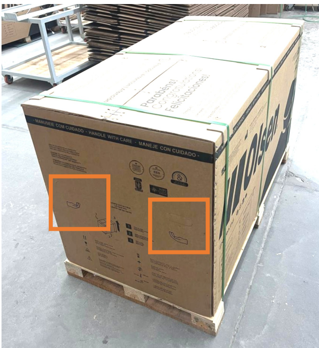
Fig. 1 - Identificação do recorte na caixa